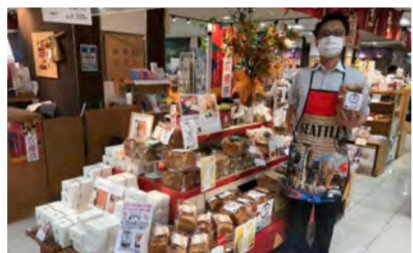
9/28「三重リポート」近鉄四日市店「伊勢路テラス」