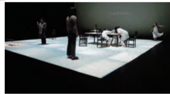
【かもめ】2014年・台湾公演<第七劇場>

ワンコインコンサート 10/30(金) ピアノ 阪田知樹 会場/三重県文化会館・大ホール 開場/10:30 開演/11:30 席種・料金(税込)/全席指定 500円(前売り) ◎三重県文化会館チケットカウンター TEL059-233-1122