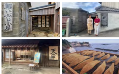
9/14「三重リポート」志摩市かつおの天ぷら